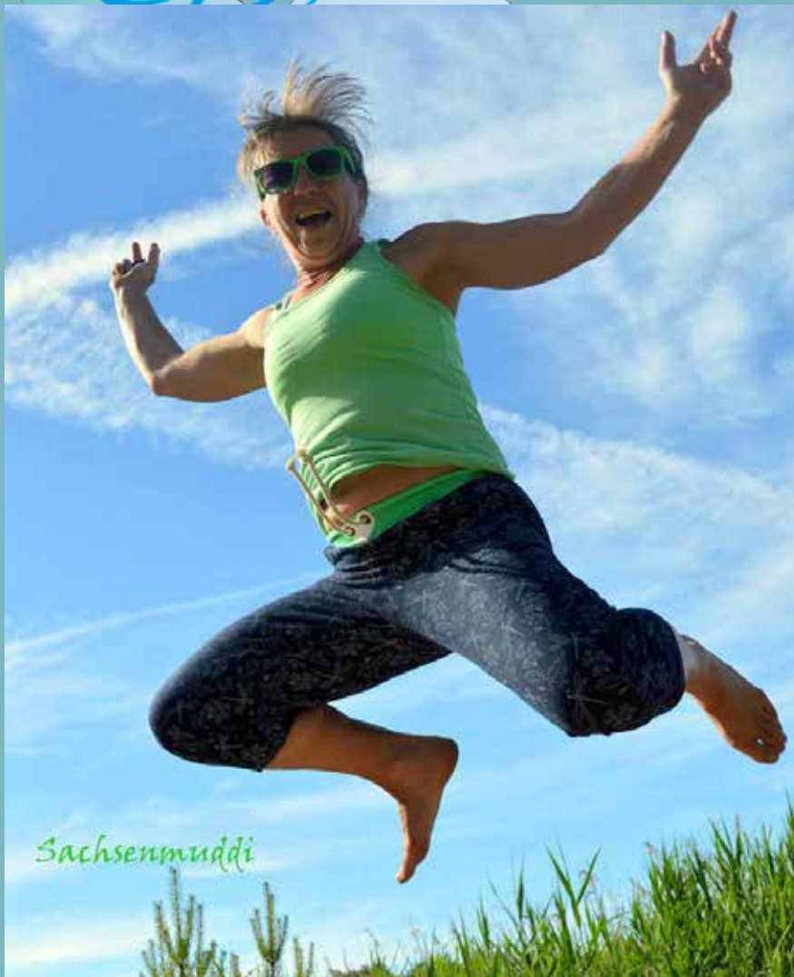
Kathrin von Sachsenmuddi