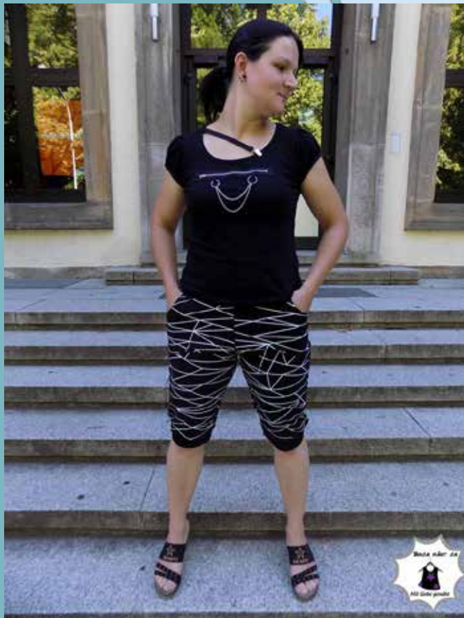
Tanja von Tnaja näht ja