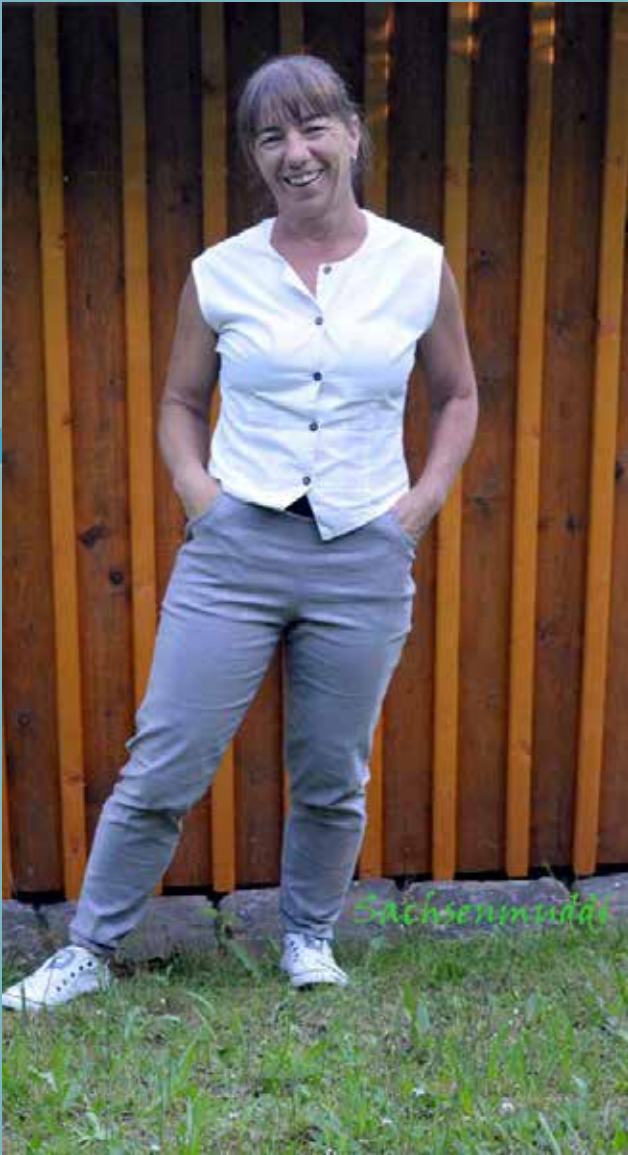
Kathrin von Sachsenmuddi