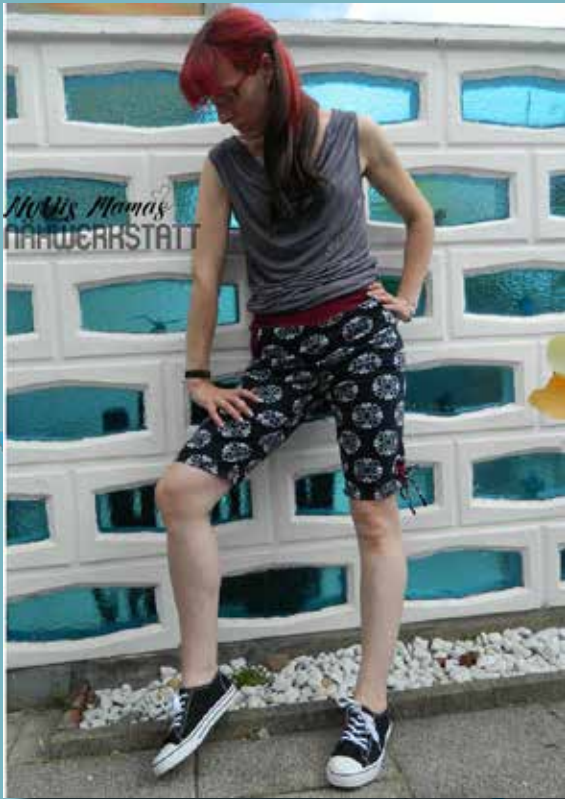
Tronnie von Mittis Mamas Nähwerkstatt