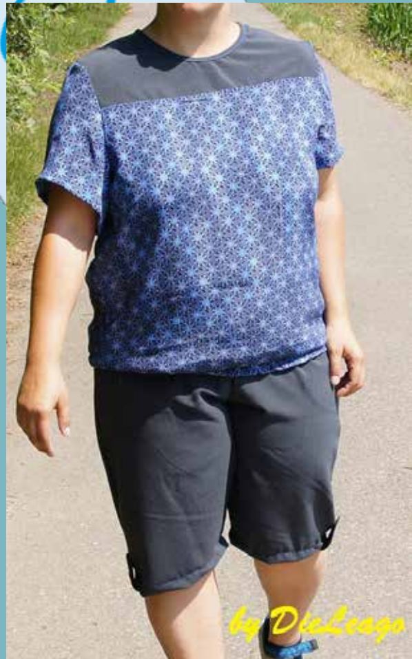
Sandra von Die Leago